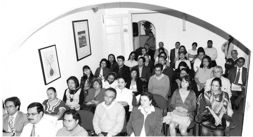
Profesores asistentes a la inauguración del Centro

Palabras tomadas del discurso pronunciado en la inauguración del Centro de Formación Docente del CCH