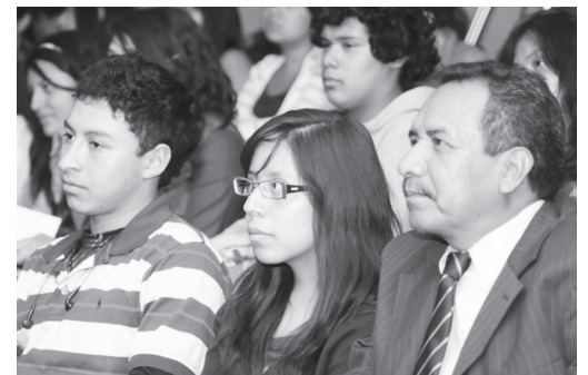
Alumnos y profesores del Plantel

(Con información del programa Jóvenes hacia la Investigación en Ciencias y Humanidades del Plantel Naucalpan).