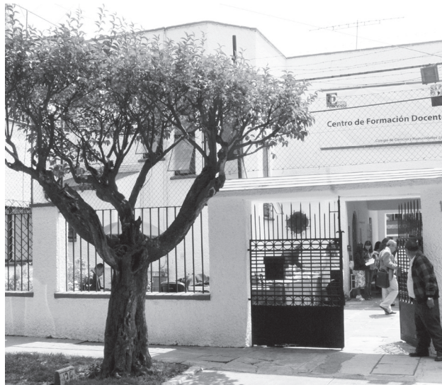
Instalaciones del Colegio en la calle de Gut y Cárdenas