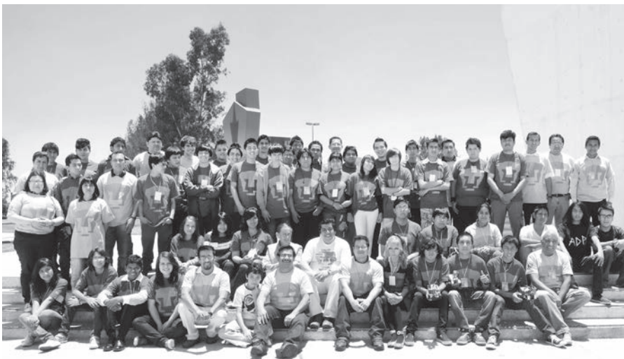
Equipo que representó al CCH