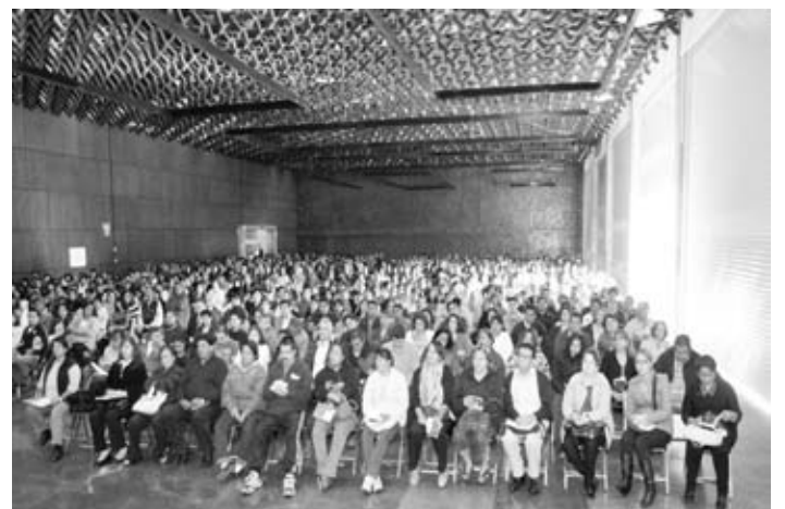
Padres de familia del Plantel Vallejo en el Centro Cultural Tlatelolco