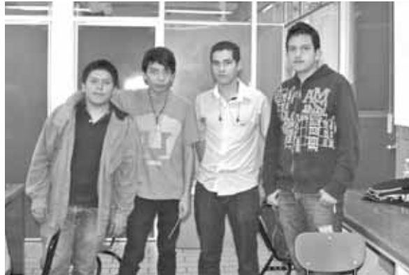
Integrantes del equipo Rescue CCH Nau

Los estudiantes del Plantel Naucalpan concursaron en las distintas pruebas de la Categoría Rescate B, las cuales consistieron en detectar una víctima mediante señales de calor e identificar su dirección. El objetivo fue resolver un laberinto, encontrar víctimas y regresar al punto en donde se inició. Su equipo denominado Rescue CCH Nau dio muestras de efectividad en este ejercicio en el que se simulan casos de la vida real, ya que a partir de un desastre ganan los que rescatan a una mayor cantidad de víctimas.