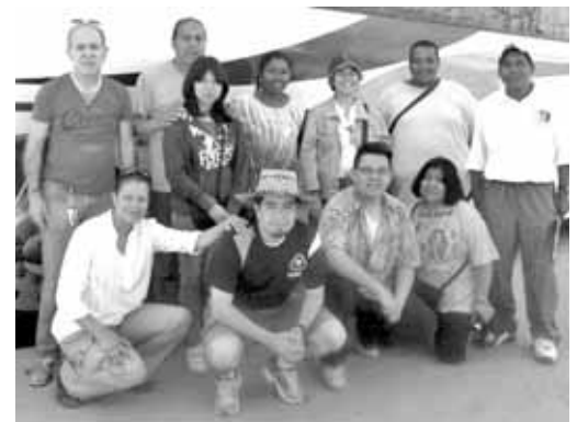
Algunos investigadores del equipo