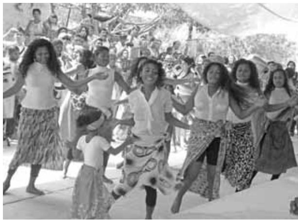
Fiesta de la comunidad de Cuajinicuilapa

El proyecto realizado por los académicos y alumnos del Plantel Naucalpan, al que se suman estudiantes de licenciatura, maestrantes y doctorantes de Antropología y Sociología de las universidades Complutense de Madrid, Au-