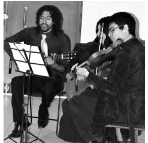
Grupo Son de Cuerda