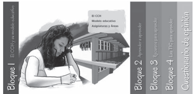
Tutorial de Estrategias de Aprendizaje

Hasta ahora han ingresado al tutorial más de 13 mil 200 alumnos.