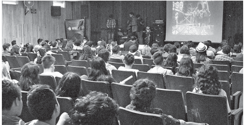
Premiación en plantel Vallejo