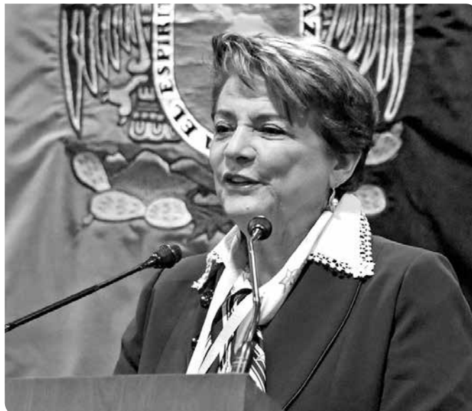
Dolly Montoya Castaño

“La Universidad Nacional de Colombia es un proyecto cultural arraigado en el país, el más estable desde su independencia, que trabaja de manera permanente en la construcción del tejido social con mentalidad colectiva”, indicó Montoya Castaño, rectora de dicha casa de estudios, al hacer uso de la palabra. Para concluir su intervención, agradeció a la UNAM la calidez con que fueron recibidos los integrantes de su equipo de colaboradores colombianos.