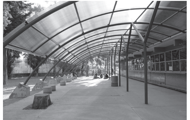
Es importante cuidar las instalaciones para que puedan ser disfrutadas por las próximas generaciones

Como se aprecia, este año será de mucho trabajo, por lo que será fundamental que la comunidad cecehachera colabore en las múltiples actividades académicas que tienen como propósito mejorar el nivel educativo del Colegio, para seguir siendo un centro educativo innovador. ▣