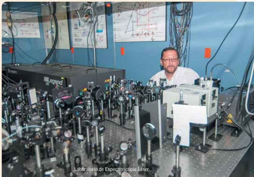
Laboratorio de Espectroscopia Láser.

El Instituto de Química hará el mejor esfuerzo por recibirlos en sus laboratorios, de tal suerte que no hagan labores triviales, sino que aprovechen los conceptos y fundamentos de química con que cuentan, comprendan los roles de la investigación, se involucren en el trabajo y los procesos corres-