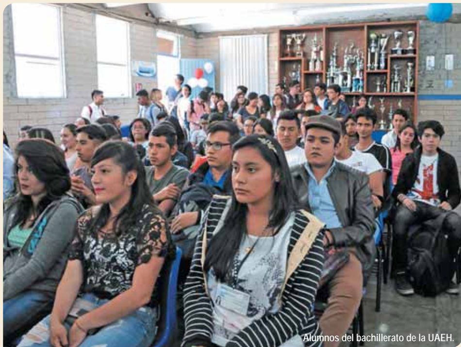
Alumnos del bachillerato de la UAEH.