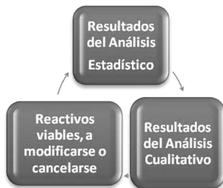
Esquema: Análisis de reactivos.

Los profesores realizamos el análisis de los resultados para plantear una posible explicación de los mismos y reflexionar sobre el significado del valor obtenido en cada indicador estadístico del examen. Posteriormente, se avanza hacia un análisis más particular de cada reactivo.