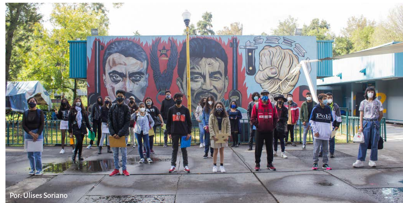
Por: Ulises Soriano

con el alma aferrada a la dulce esperanza