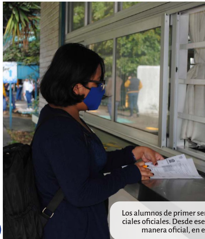
Los alumnos de primer semestre recibieron sus credenciales oficiales. Desde ese momento se convirtieron, de manera oficial, en estudiantes de la UNAM