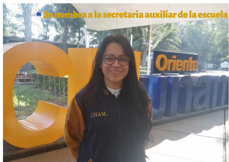
* Se nombra a la secretaria auxiliar de la escuela