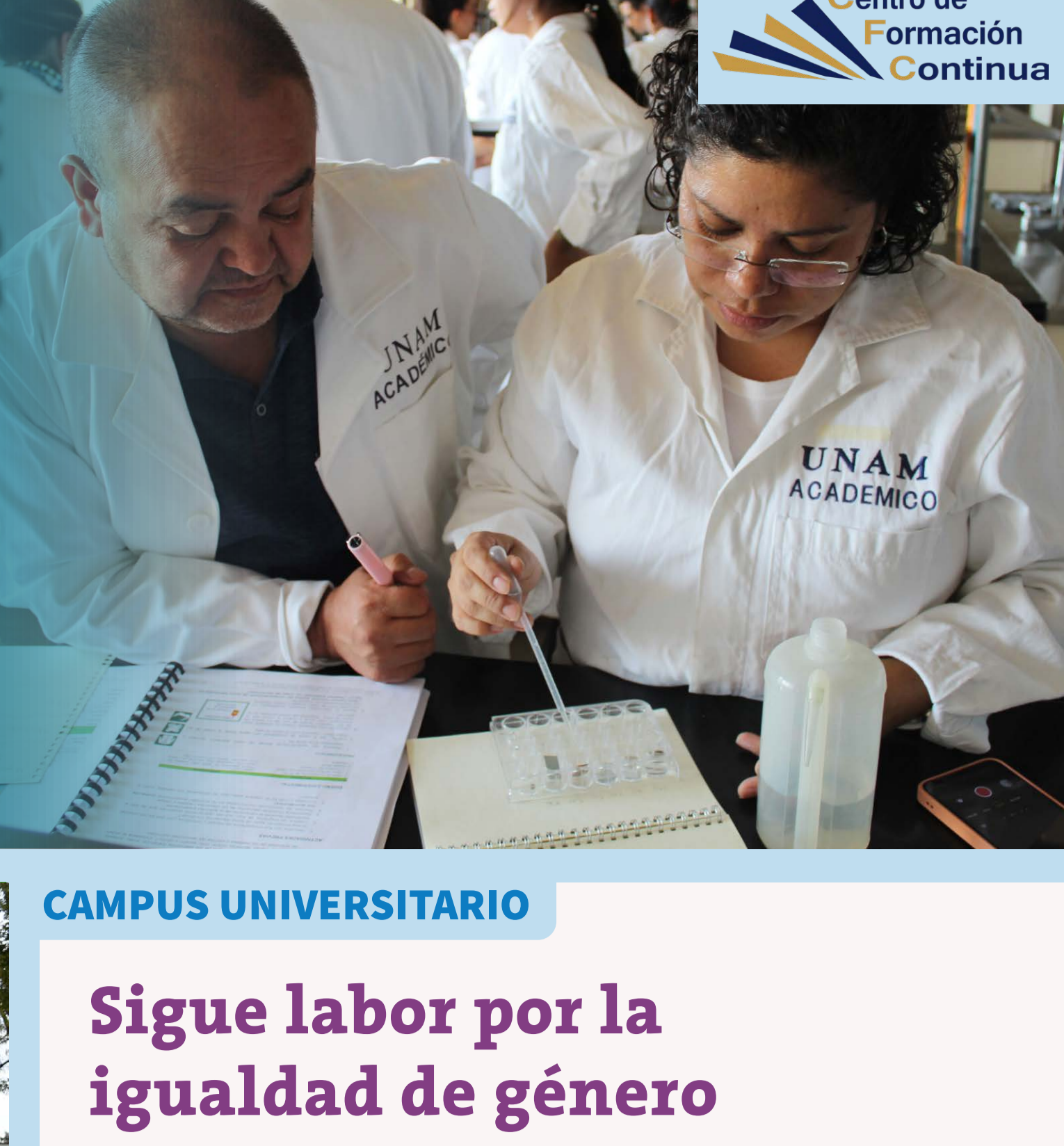
Centro de Formación Continua

En la inauguración de la segunda edición de este diplomado, en el plantel Vallejo, el funcionario comentó que este programa tiene una visión vanguardista, pues aborda el tema de la transversalidad, ya que se debe llevar a cabo la actividad experimental desde microinvestigaciones que no comprometan muchos recursos, pero sí generen un impacto económico y ambiental. En ese sentido, el CCH innova con perspectiva de desarrollo sostenible y la enseñanza experimental y social.